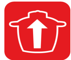
BOL XL 4,8 L