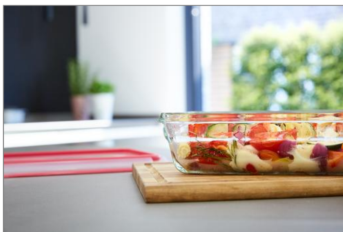
CLIP&CLOSE Verre ronde 0,1 L Boîte ronde 0,1 L rouge N1040100

Food storage container Boîte alimentaire