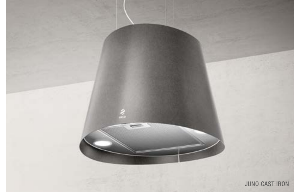
JUNO CAST IRON