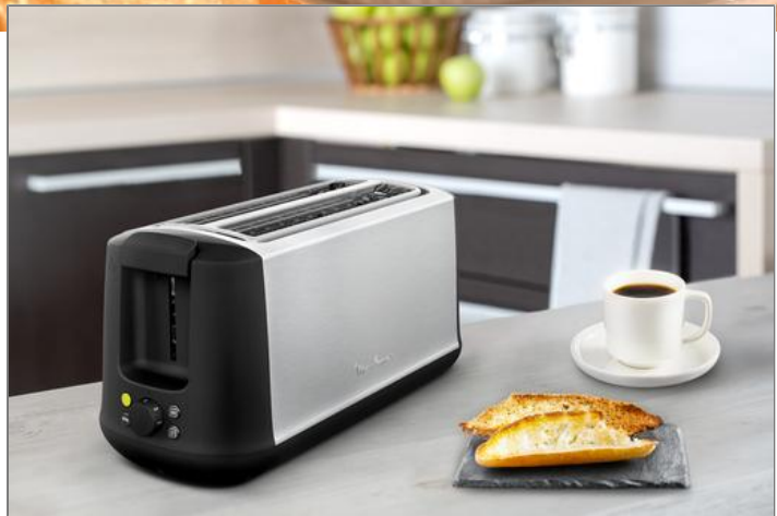
Subito Select Grille pain LS342D10

Grâce aux deux longues fentes et à la fonction ECO exclusive du grille-pain Subito Select, grillez uniquement la quantité de pain dont vous avez besoin sans gaspiller d'énergie.