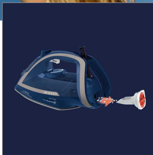
ULTRAGLISS ANTI CALC PLUS 2800 W BLEU/SILVER FER A REPASSER FV6830C0