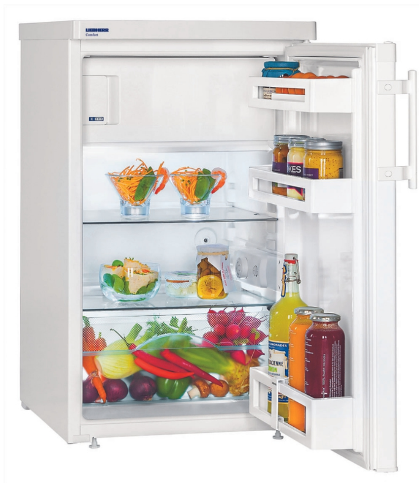
Table top 50 cm 4* Comfort