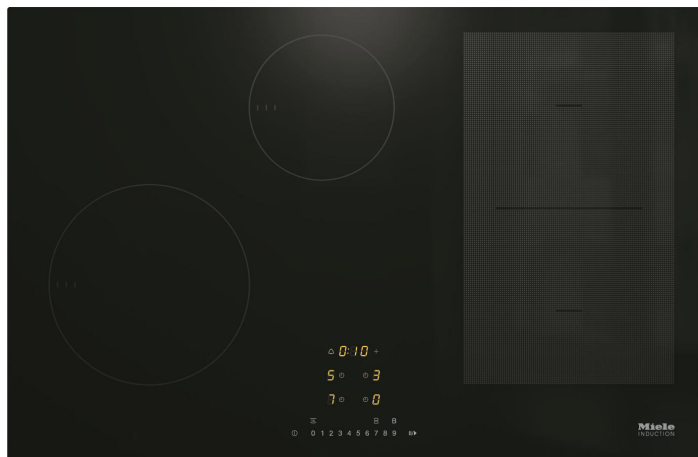
TABLE DE CUISSON KM 7414 FX