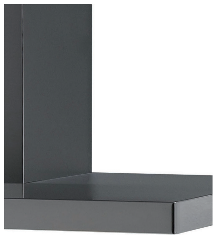
Bandeau de 40 mm