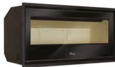
Silver 1000 Plus