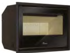
Silver 700 Plus