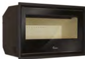
Silver 800 Plus