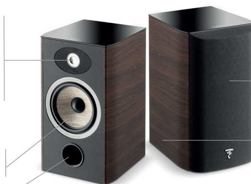
Aria 906 Noyer

Évent frontal aérodynamique Faible distorsion