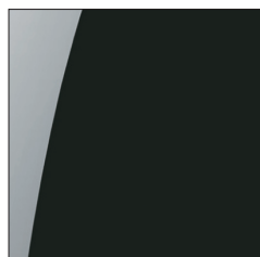
Black High Gloss